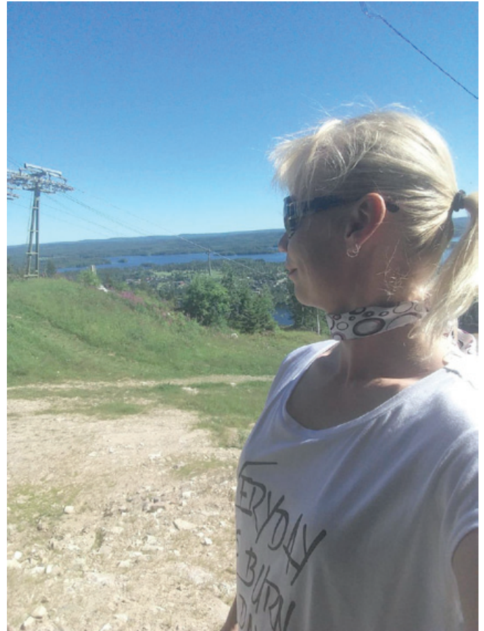
Heli kiivennyt Tahko-vuorelle