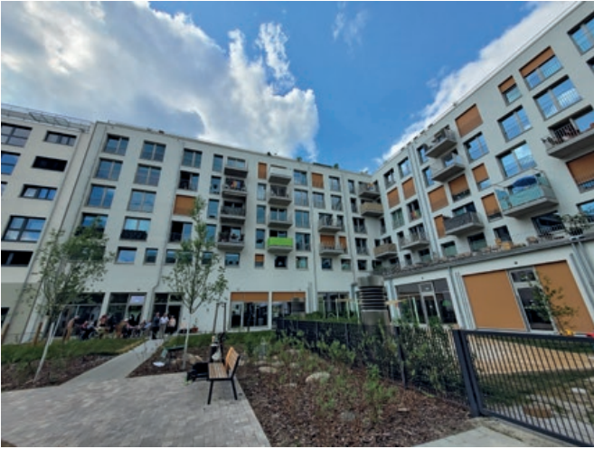
Sisäpiha, jossa myös päiväkodin piha.

Alakerrassa on tuetun työllistämisen avulla työskentelevien sateenkaariasukkaiden ylläpitämä kahvio, josta saa eurolla kahvin ja maukkaan kakkupalan. Kahvio on ahkerassa käytössä, ja siellä mekin ehdimme kuulla useita värikkäitä elämäntarinoita. Yksi niistä oli erään taiteilijan, joka oli esiintynyt taiteenteon ohella hurmaavana Marlene Dietrichinä. Kahviossa ja sen vieressä sijaitsevassa sateenkaariystävällisessä ravintolassa järjestetään erilaisia tilaisuuksia, kuten syntymäpäiviä ja muita merkkitapahtumia.