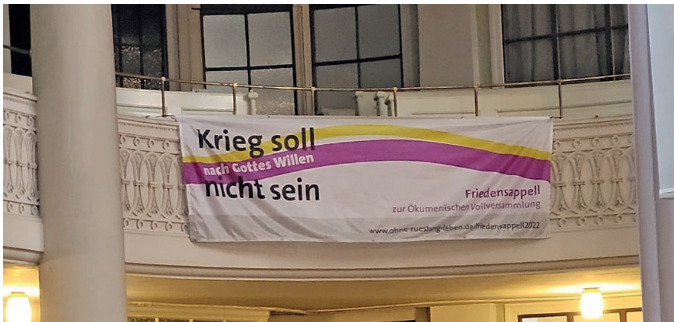
Sodanvastainen juliste Nikolainkirkon seinässä.

tapaa käyttää kristinuskoa omien epäoikeudenmukaisten rauhanvastaisten päämääriensä toteuttamiseen. Nimiä hän ei maininnut, mutta se ei ollut tarpeenkaan. Hän oli huolissaan ihmisten välinpitämättömyydestä toisiaan kohtaan ja vallitsevasta itsekkyydestä. Hän peräänkuulutti kristityn vastuuta ja myös seurakuntalaisten aktiivista poliittista osallistumista. Ennen kaikkea ihmisten tuli äänestää tulevaisuudessa osavaltiovaaleissa demokratian puolesta eikä antaa tilaa äärioikeiston valtaan pääsulle, sillä tällaisesta on Saksalla järkyttävät kokemukset.