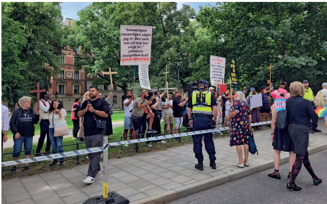
Emeritaprofessori Angelica muistuttamassa fundamentalisteja siitä, mistä kristinuskossa on oikeasti kyse.

Paraatin loppupuolella tapahtui jotakin vakavaa. Puiston laidalla joukko aggressiivisia ihmisiä huuteli meille iskulauseita ja heiluttelivat roomalaisia teloitusvälineitä. "Oliko heillä tarkoitus käydä väkivaltaiseksi, pohdin". Joku meistä ymmärsi huikata heille, että "We love you, too!". Näin toimimme Raamatullisesti noita vihaisia ihmisiä kohtaan. Onneksi paikalla oli virkapukuisia poliiseja turvaamassa meidän kulkuettamme. Siviilipukuisia emme havainneet, mutta sisarjärjestön kertoman mukaan heitä oli runsaasti yleisön joukossa mahdollisten äärioikeistohyökkäysten varalta. Joskus Soldiers of