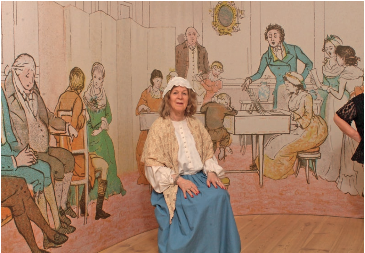
Nautiskelemissa Fanny Mendelssohnin musisoinnista hänen salongissaan.