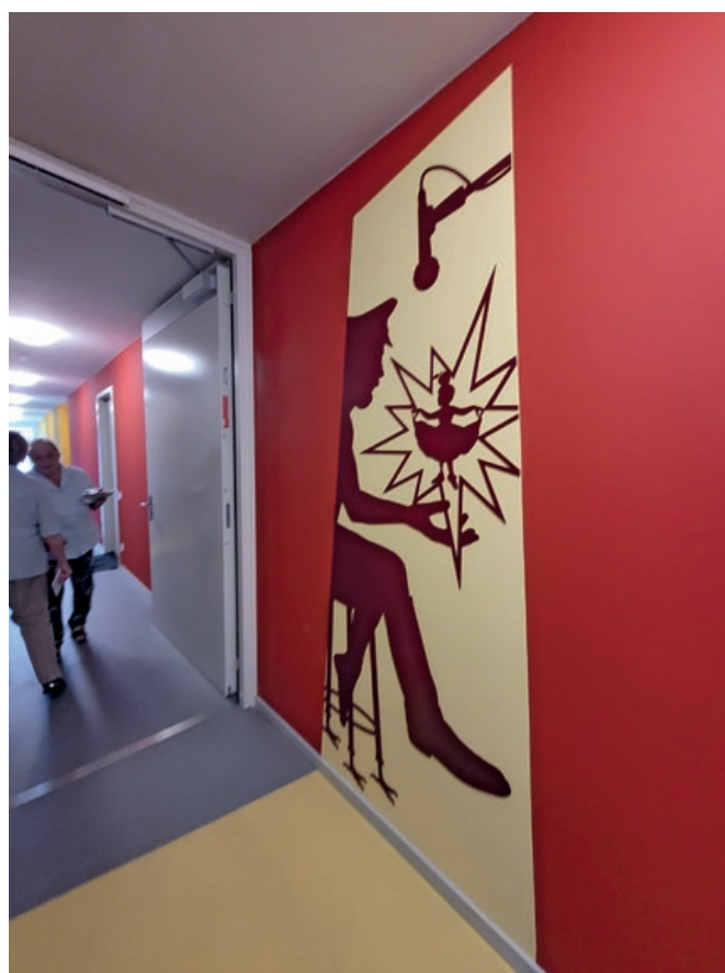
Porraskäytävissä oli erilaisia seinämaalauksia. Kuvan naiset pyysivät meitä katsomaan omiaan.

sateenkaari-ihmisille. Laaja sisäpiha on yhteiskäytössä korttelin muiden talo-osuuskuntien kanssa. Toimintakyvyn heiketessä tarjolla on myös hoito- ja kuntoutuspalveluita, ja osa asukkaista asuukin varsinaisella hoito-osastolla.