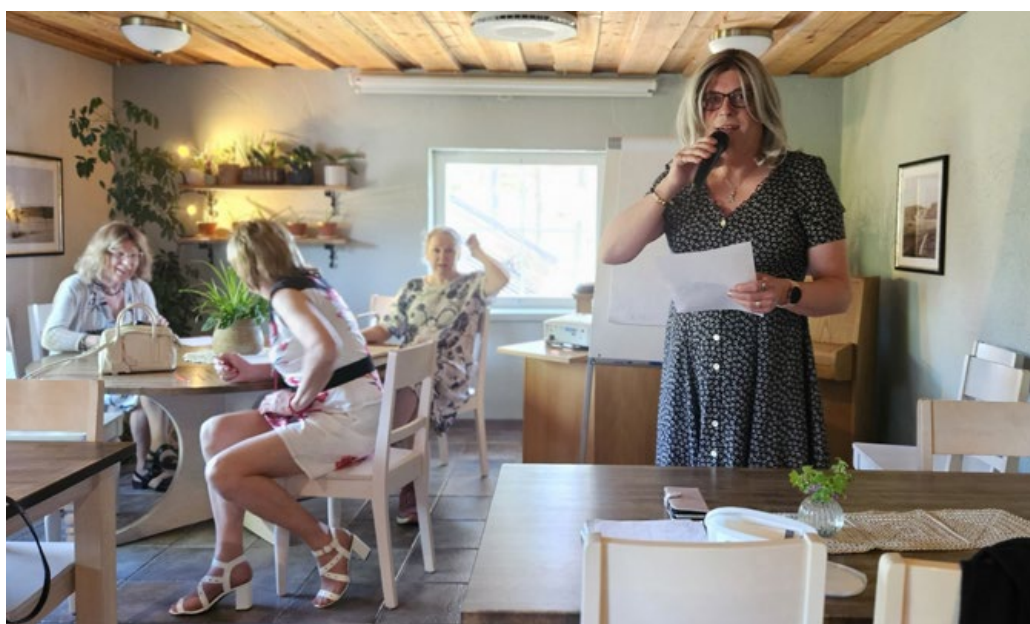
la purkaa ryhmätyötä kehittämistyöpajassa.