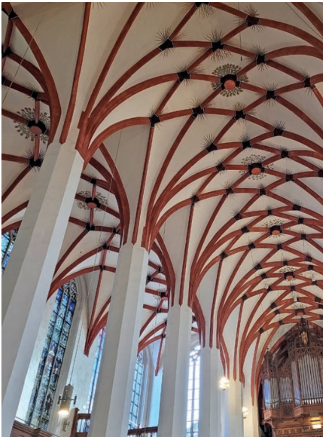
Tuomaskirkko sisältä ja vähän ulkoakin.