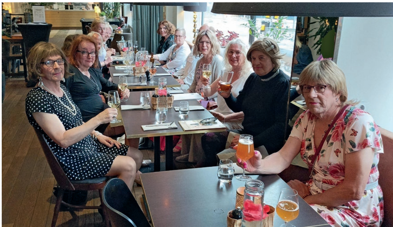
DwC:n ja FPES:n yhteinen illallinen.

Illallisella meitä oli 10 suomalaista ja 5 ruotsalaista. Osa viimeksi mainituista oli osalle meistä tuttuja, olihan FPES vierailut pari kertaa Helsingissä ja me taas vastavuoroisesti Tukholmassa. Sijoituimme siten, että meillä oli mahdollisuus keskustella mielenkiintoisista asioista. Päällimmäinen havaintoni oli se, että meillä molemmilla mailla on hyvin samantyyppinen kokemusmaailma sekä samat ilot ja murheet. Pystyimme antamaan syvällisempää tietoa yhdistyksestämme historiikin ja jäsenlehden irtonumeroiden kautta. Ilta päättyi siihen, että saimme kutsun FPES:n blokkiin Pride-kulkueessa. Numero oli 16.