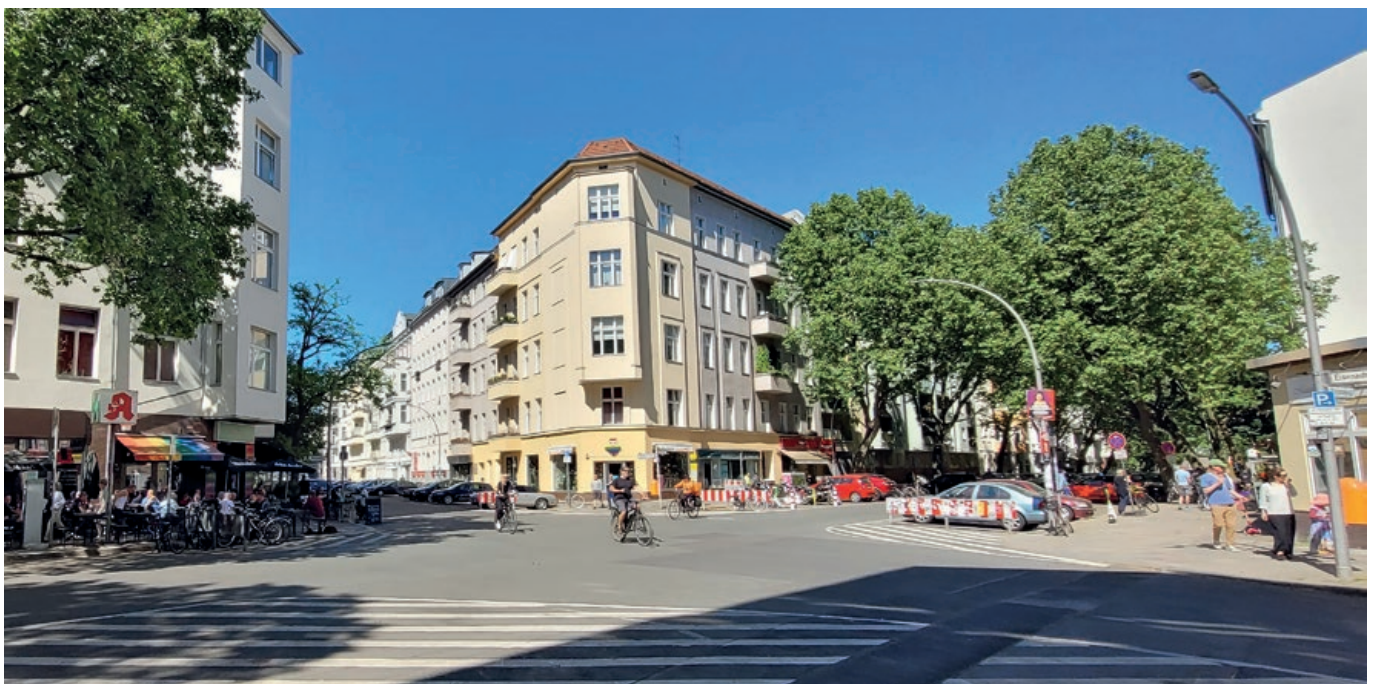
Näkymä nurkkatalossa sijainneeseen Eldorado-yökerhoon SA:n päämajan suunnasta katsottuna.