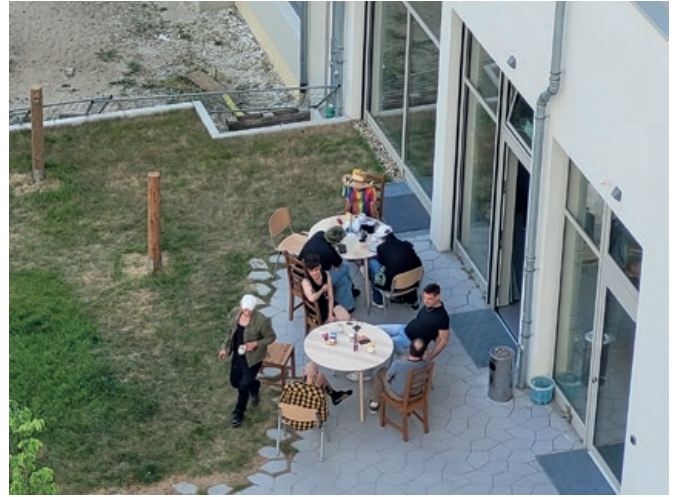
Kahvion terassi 5. kerroksesta nähtynä. Viereinen osuuskunta-asuntojen talo on vielä kesken

Äärioikeistolaiset häiriköt olivat myös tunkeutuneet päiväkotiin korjausmiehiksi tekeytyneenä levittäen sen WC-tiloihin sinänsä vaaratonta, mutta erittäin epämiellyttävän hajuista voihappyä. Häiriöiden vuoksi poliisi on ottanut talon seurantaansa, ja käydessämmekin sen edessä oli poliisiauto parkissa.