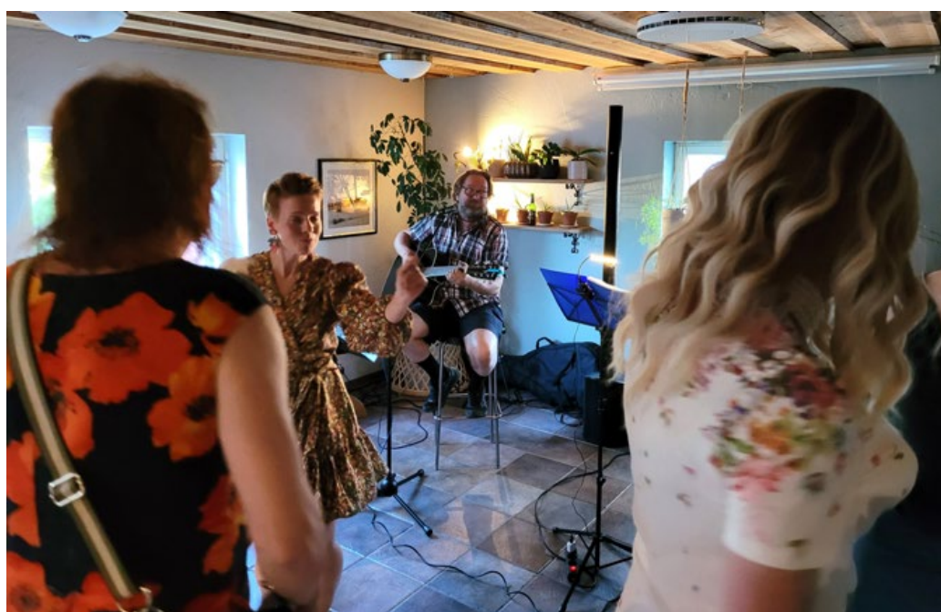
Lauantai-iltana Morvan emäntäkin veti ylleen bilemekon, ja tuli mukaan joraamaan.