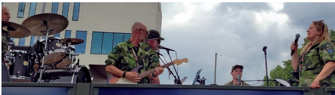
Ruotsin armeijan rekassa oli motto: "Vi skall kämpa till sista hen!"

Poliiseilla, kuten muillakin ammattiryhmillä, oli oma osastonsa. Armeija, pelastusviranomaiset, hoitajat, yms. halusivat marssimalla osoittaa kannustavansa ihmisten yhdenvertaisuutta sukupuolesta, sukupuoli-identiteetistä, seksuaalisesta suuntautumisesta huolimatta. Hienoa oli nähdä nämä kaikki ihmiset, jotka nimenomaan korostivat rakkautta lähimmäistä kohtaan.